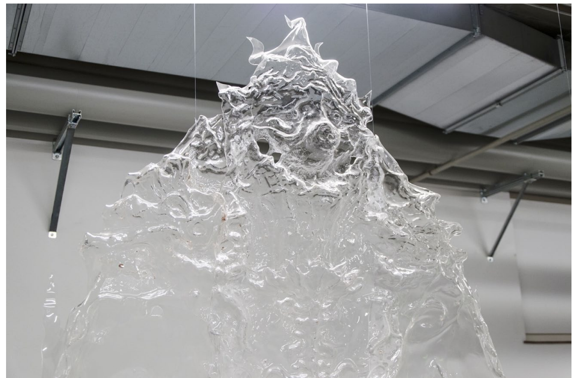
Saugott oder die lernäische Schlange 2022 Polystyrol 300 x 250 x 25cm, Materialstärke 2mm

Ausstellungssansicht: «Geschichten aus dem Hain», Oxyd, Winterthur, 2022.