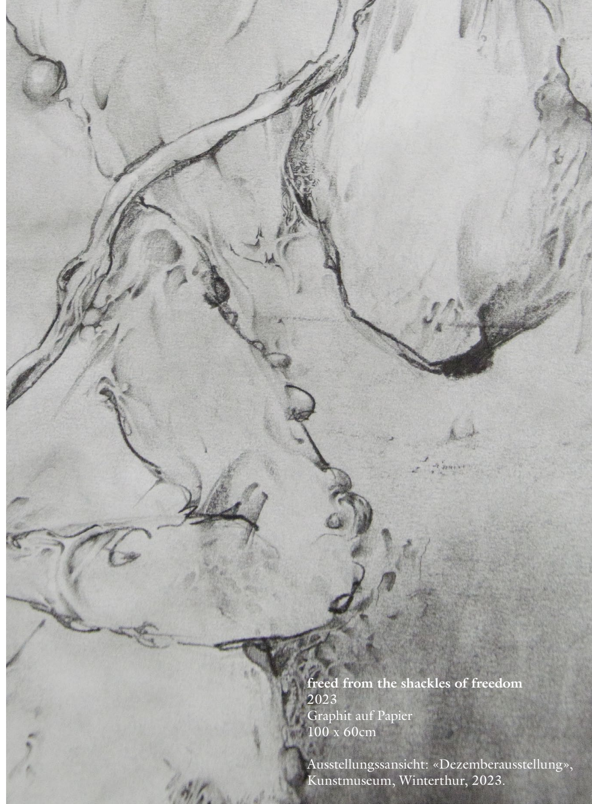
freed from the shackles of freedom 2023 Graphit auf Papier 100 x 60cm

Ausstellungssansicht: «Dezemberausstellung», Kunstmuseum, Winterthur, 2023.