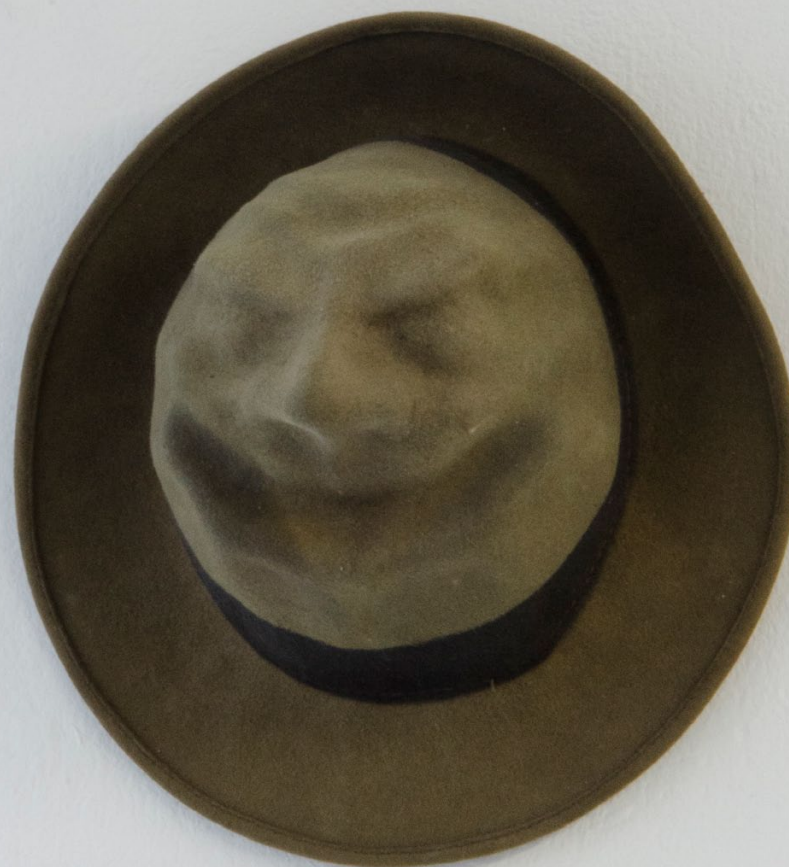
Hut 2024 Filzhut ø35 x 25cm

Ausstellungssansicht: «ein Häuschen in Nöten», lokal-int, Biel, 2024.