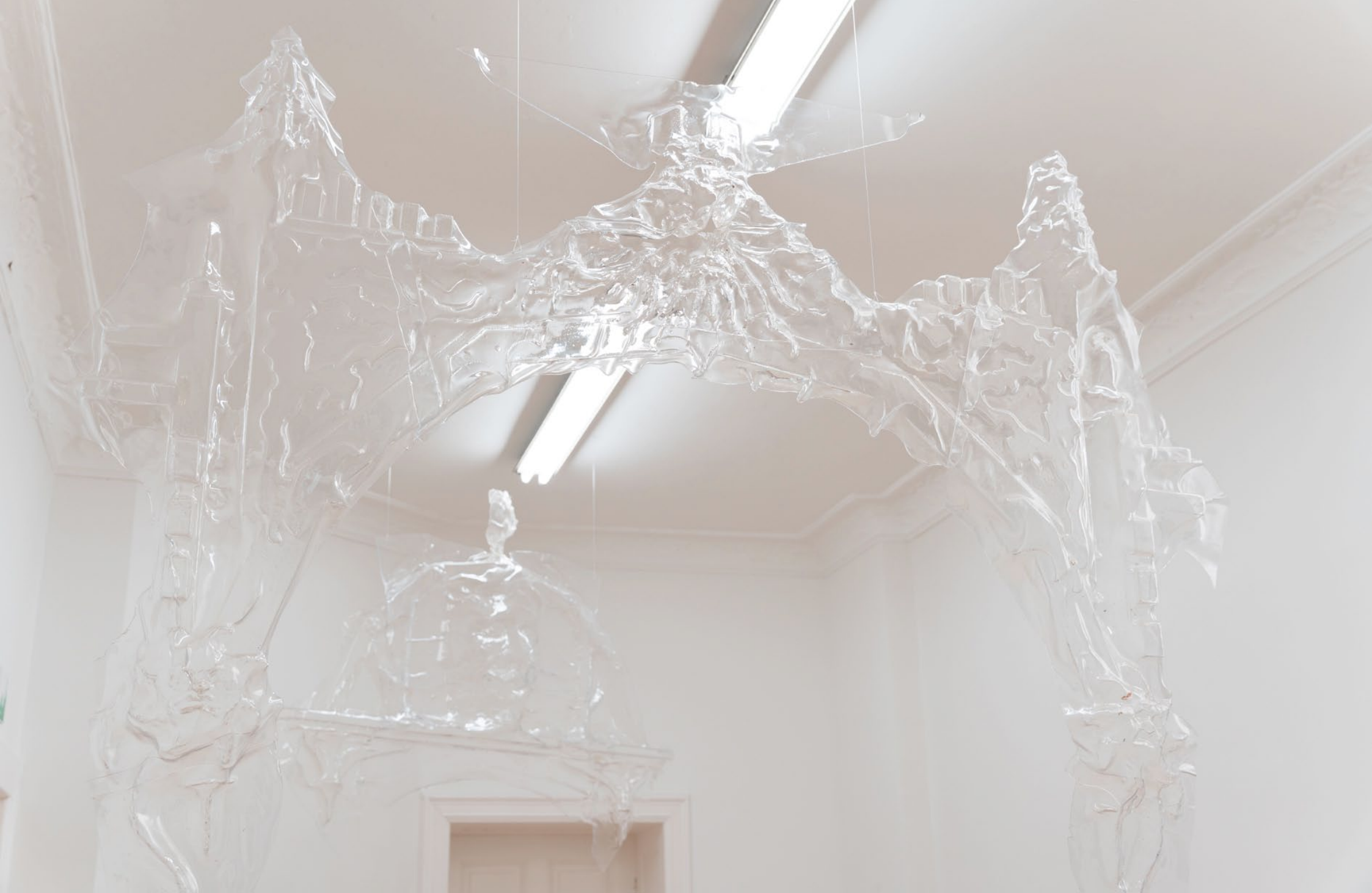
Ausstellungssansicht: «A Patience Game», Holden Garage, Berlin, 2022.