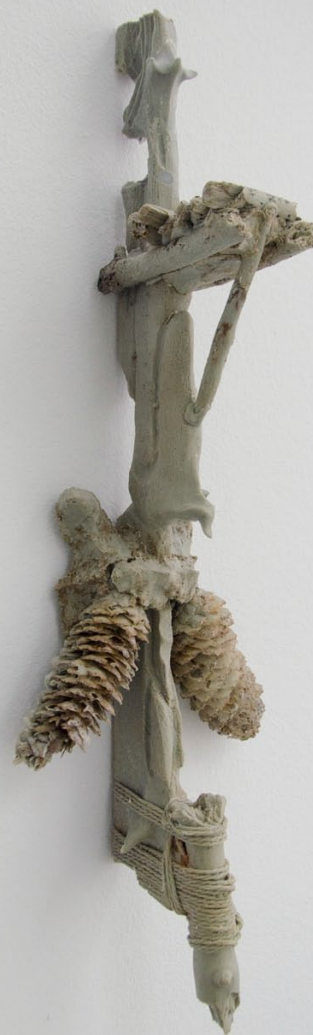
preconceived ranarchitecture II & I (rechts) 2023

Polyurethanguss 46 x 12 x 13 cm (II), 55 x 19 x 13 cm (I)